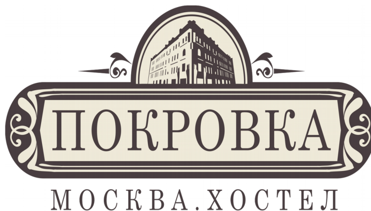
Рис. 1. Логотип хостела «Покровка»

Печать основного текста после наименования рисунка начинается через два полуторных междустрочных интервала.