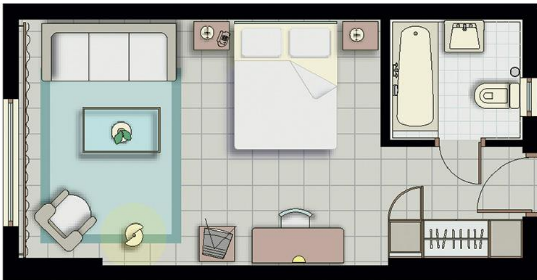
Схема гостиничного номера категории «стандарт»